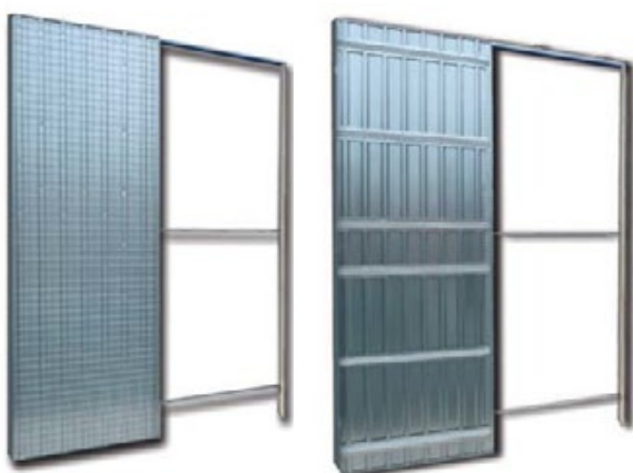
POUZDRO ZDP - zděná příčka