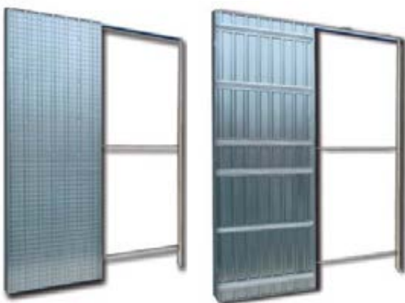
POUZDRO ZDP - zděná příčka